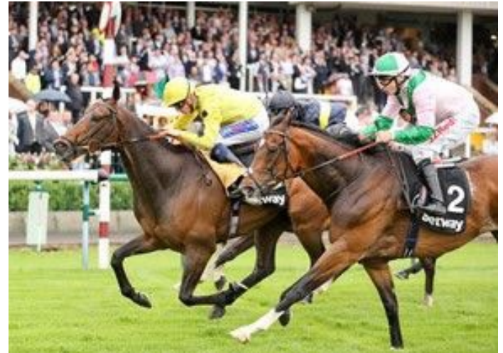
Absolutely So (li.) kommt knapp hin.

Drei schon etwas ältere Wallache machten dieses Rennen unter sich aus, wobei Absolutely So nach zwei Listensiegen jetzt seinen ersten Gruppe-Treffer erzielte, in diesem Rennen war er vor zwei Jahren schon einmal Dritter. Vor sechs Jahren mit 230.000gns. ein teurer Jährling bei Tattersalls ist er ein Sohn des irischen Spitzenvererbers Acclamation (Royal Applause) aus einer nicht gelaufenen Stute, die nur noch einen weiteren Sieger auf der Bahn hatte. Sie ist Schwester einer listenplatziert gelaufenen Iffraaj -Tochter, die Mutter Tarfshi (Mtoto) war Siegerin in den Pretty Polly Stakes (damals Gr. II). Sie ist Schwester der in den Cheveley Park Stakes (Gr. I) erfolgreichen Embassy (Cadeaux Genereux).