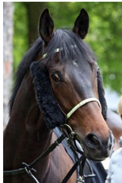
Der Haßlocher Sieger Ardashir.

Ein leichter Sieg des Favoriten Ardashir , der sich gelegentlich schon in ganz anderer Gesellschaft versucht hatte und für den Auktionsrennen anstehen könnten. 70.000 Euro hatte er als Jährling bei Goffs gekostet, er ist dann im Herbst 2015 noch einmal in den Iffezheim in den Ring gegangen, wurde jedoch zurückgekauft. Er stammt aus den USA, war dort als