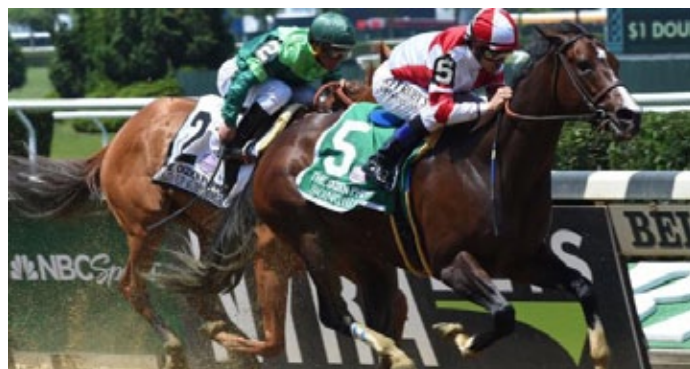
Songbird meldet sich in den Ogden Phipps Stakes erfolgreich aus der Pause zurück.

Die 28.000 Dollar, die der Besitzergemeinschaft Allofs/Fährhof nach dem siebten Platz von Potemkin (New Approach) in den Woodford Reserve Manhattan Stakes (Gr. I) überwiesen werden, waren nur ein Trostpreis, denn es war mehr drin gewesen. Jockey Joel Rosario (Eddie Pedroza war gesperrt) nahm das Rennen vom letzten Platz auf, war nie so recht auf Positionsverbesserung bedacht, und konnte am Ende so nur