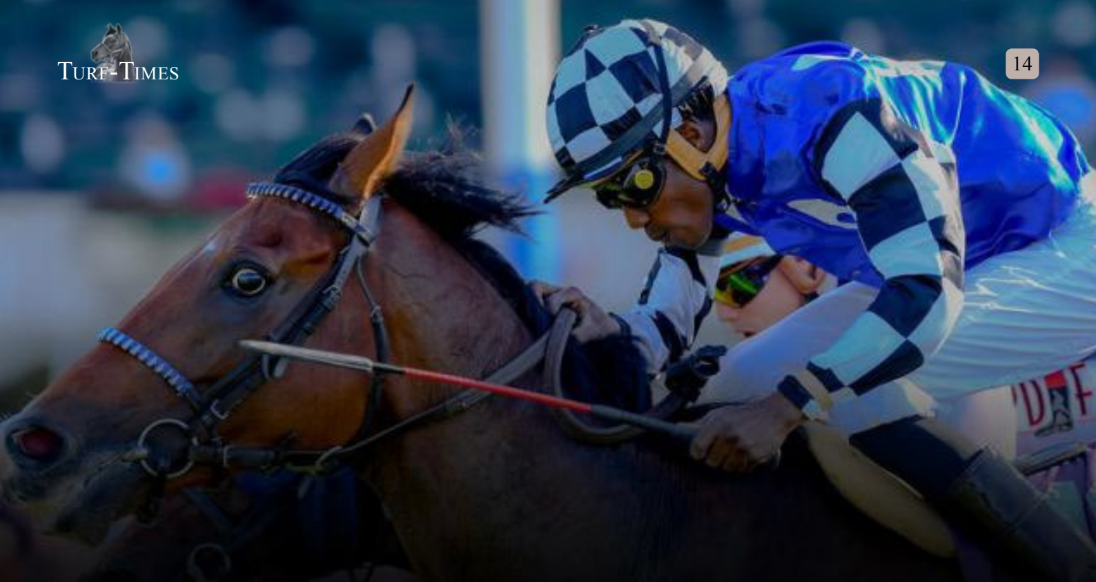
Red Cardinal gewinnt unter Eddie Pedroza den Belmont Gold Cup.