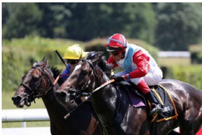
Sternkranz kommt gegen So Tough knapp zu seinem ersten Erfolg.

Das IDEE 148. Deutsche Derby könnte laut seinem Besitzer jetzt auf dem Fahrplan von Sternkranz stehen, womit der Hengst, der es bei seinen bisherigen Starts stets mit guter Konkurrenz zu tun hatte, natürlich einen enormen Sprung gewältigen muss. Es ist auch sicher müßig zu diskutieren, ob der Kamsin -Sohn nicht im