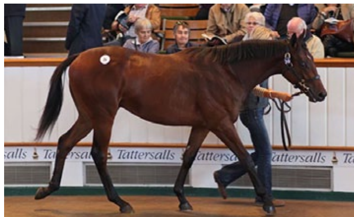
Glorious Journey im Auktionsring.

2,6 Millionen gns. hatte Glorious Journey ( Dubawi ) aus der Zucht des Normandie Studs vergangenes Jahr bei der October Yearling Sale von Tattersalls gekostet, Godolphin hatte das Geld damals auf den Tisch gelegt. Schon eine gewisse Bürde für den jetzt zwei Jahre alten Hengst, den Trainer Charlie Appleby am Samstag in Newmarket erstmals vorstellte. Das war in einem 1200-Meter-Rennen unter William Buick auch gleich erfolgreich, auch wenn er im Ziel nur einen Hals-Vorsprung auf den Zweitplatzierten hatte. Der Hengst ist der Erstling der Coronation Stakes (Gr. I)-Siegerin Falen For You (Dansili).