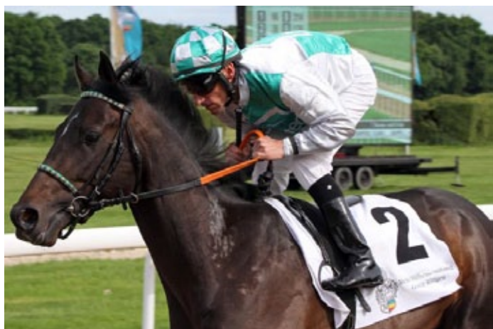
Werden Träume wahr? Dragon Lips besitzt eine Nennung für die St James's Palace Stakes am Dienstag.

St James's Palace Stakes – Gr. I, 471.000 €, 3 j., 1600 m mit Dragon Lips , Tr.: Andreas Suborics