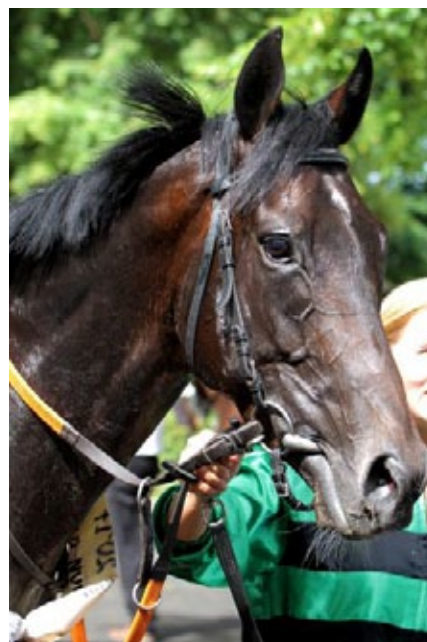
Der Derby-Favorit Colomano.

Sieben der ersten zehn im Ranking der noch im IDEE 148. Deutschen Derby startberechtigten Pferde waren im Ring der BBAG-Jährlingsauktion 2015 – das ist schon rekordverdächtig. Colomano, Windstoß, Langtang, Northsea Star, das sind die Top 4 des Handicappers, alle vier waren in Iffezheim.