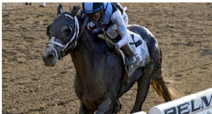
Tapwrit holt sich die Belmont Stakes.