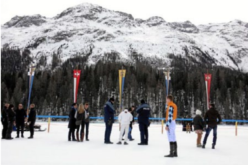
Gedrückte Stimmung: 150 Meter vor dem Ziel wurde ein Riss im Eis entdeckt, durch den Wasser nach oben stieg und das Geläuf unterspülte. Die Sicherheit der Reiter und der Pferde konnte nicht mehr gewährleistet werden. Deshalb erfolgte der Abbruch des Renntages.

Nach eingehender Untersuchung der Rennleitung und der Verantwortlichen von White Turf bildete sich ca. 150 Meter vom Ziel entfernt ein Riss im Eis von den Innenrails auf die Bahn. Dadurch stieg Wasser nach oben und sorgte für eine Unterspülung des Geläufs. Die Sicherheit der Reiter und der Pferde konnte nicht mehr gewährleistet werden.