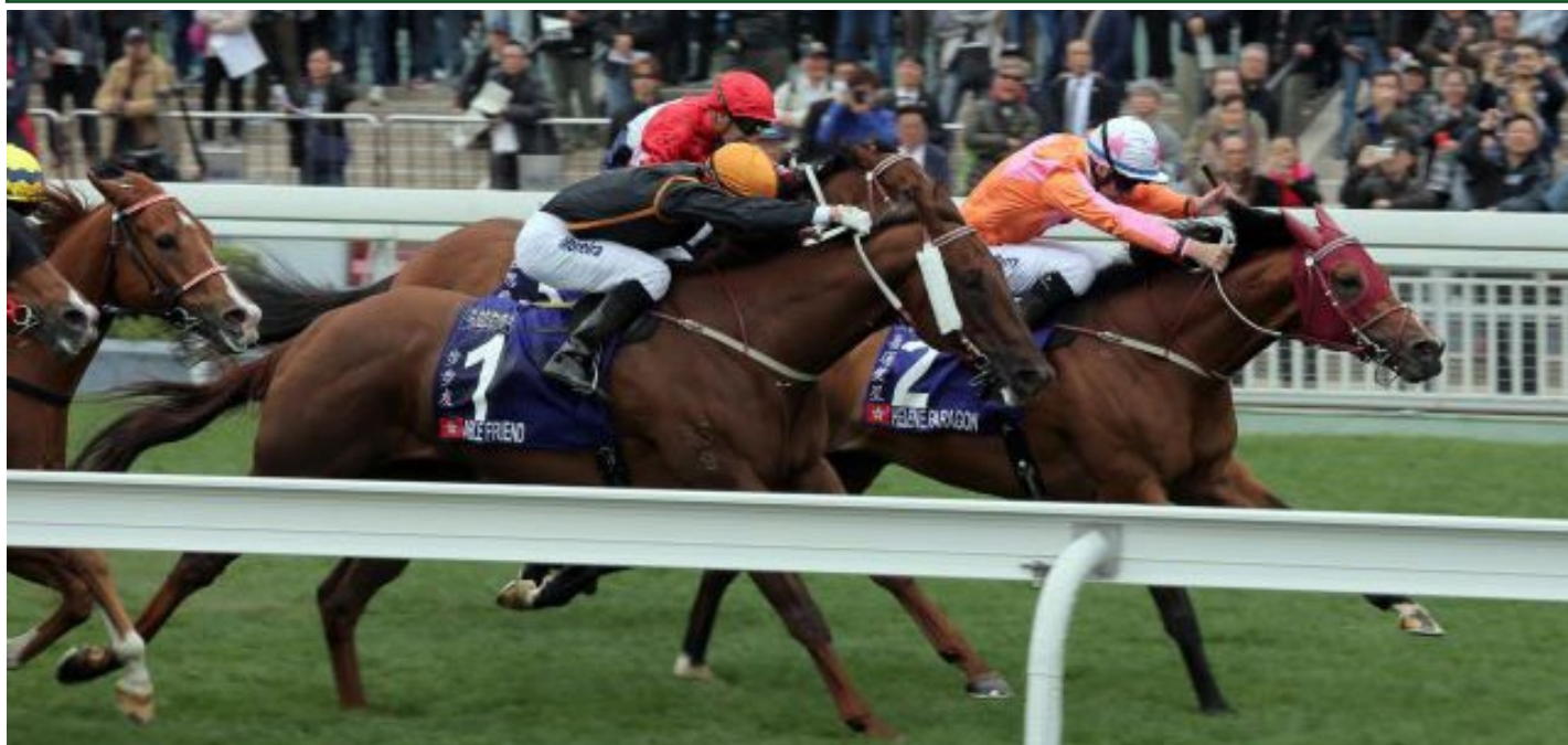
Helene Paragon schlägt den Favoriten Able Friend (Bildvordergrund)

LINGUISTIC (USA) , 1 race in Australia; grandam of VOCABULARY (AUS) , 5 races in Australia including Norman Carlyon Stanley Wootton Stakes, Moonee Valley, Gr.2 and Jayco Rose of Kingston Stakes, Flemington, Gr.3 , placed second in C F Orr Stakes, Caulfield, Gr.1 and Futurity Stakes, Caulfield, Gr.1 .