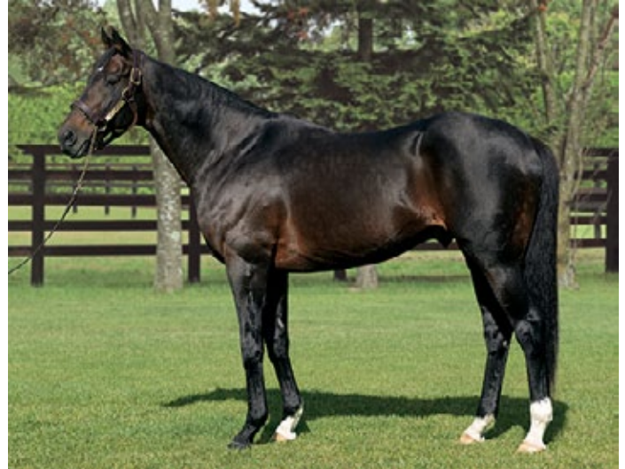
Deep Impact.

Frankreich wie die Familien Wildenstein und Niarchos, dann auch die Wertheimer Brüder, berücksichtigten ihn in ihren Planungen. Aus der Wildenstein-Zucht stammt die klassische Siegerin Beauty Parlour , erfolgreich in der Poule d'Essai des Poulisches (Gr. I). Weitere Deep Impact-Nachkommen dieser Zuchtstätte sind Aquamarine, Gewinnerin des Prix Allez France (Gr. III), und der Listensieger Barocci, Deckhengst in Schweden. Noch ungeschlagen u.a. im Prix des Chenes (Gr. III) ist