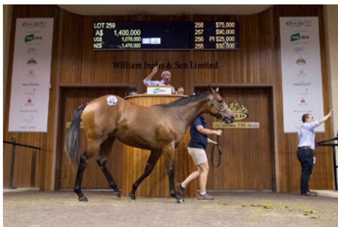
Der Rekordjährling von I Am Invincible.