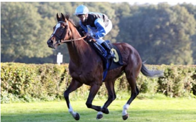
Vanishing Cupid in Hoppegarten.

Im Schweizer Gestüt Söhrenhof wird nach einem Bericht von www.horseracing.ch mit Vanishing Cupid (Galileo) ein neuer Deckhengst aufgestellt, Nachfolger für den in die französische National Hunt-Zucht abgegebenen Blue Canari (Acatenango).