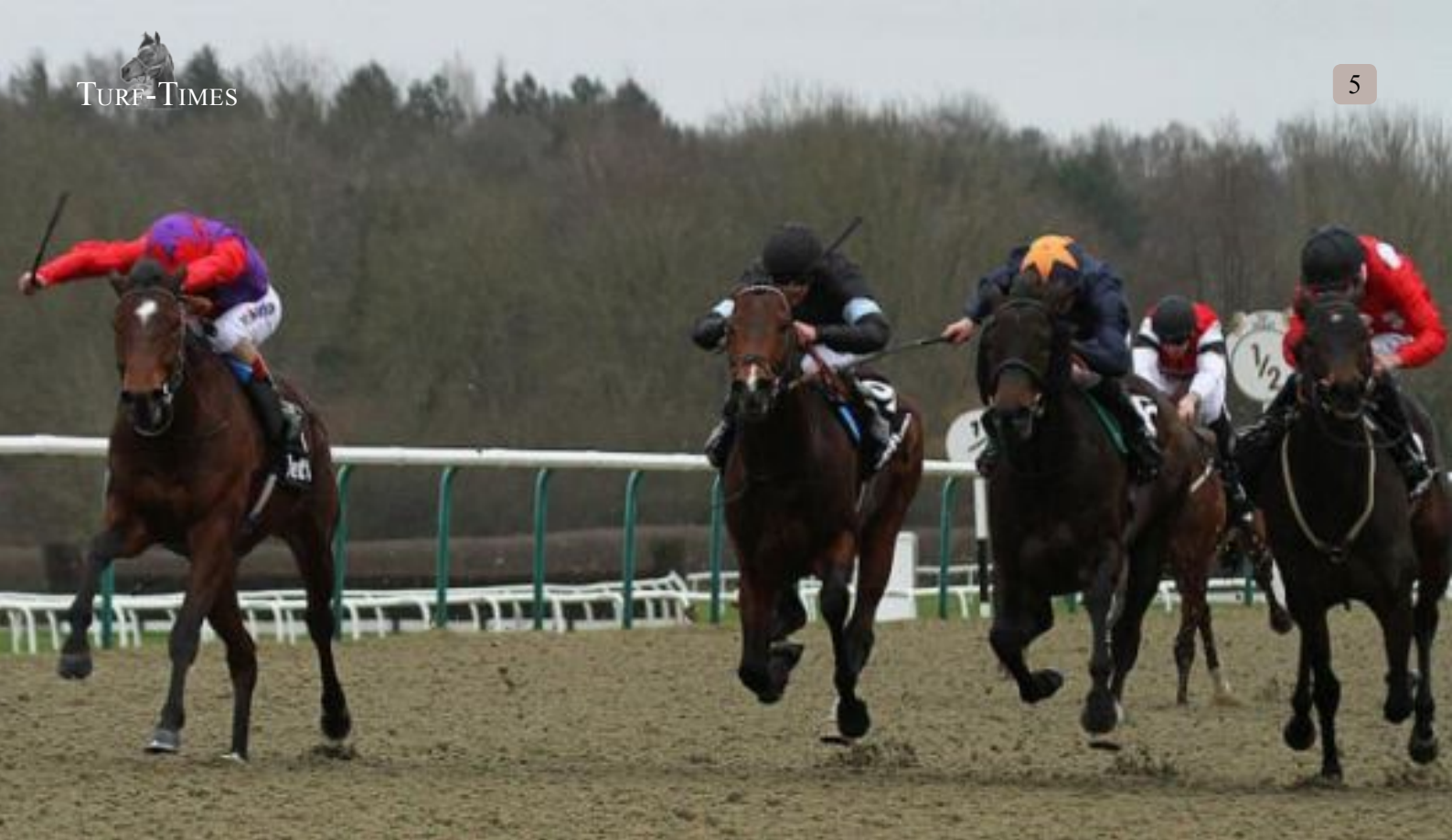
Convey (li.) gewinnt das erste Gruppe-Rennen der Saison in Großbritannien.